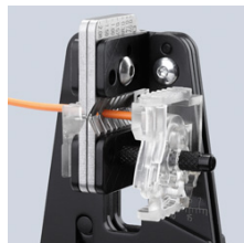
Ровное надрезание изоляции по всей окружности кабеля