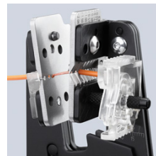
Удаление изоляции прецизионным профилем режущих лезвий точно по форме кабеля