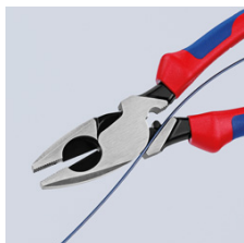
09 11/12 240: приспособление для втягивания кабеля в прорези шарнира